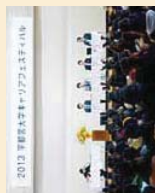
キャリアフェスティバル

1・2年生のうちからキャリアや就職について考え、体験してもらうために、全学の学生を対象にしている全学プログラム行事を行っています。 ◆キャリアフェスティバル 産業・企業の動向や、人材育成の方針、働く思い等について、業界を代表する企業や地元で活躍する企業を招いてハルディスプレイカレッジや分科会を行っています。 ◆学生支援プロジェクト 学生ならではのユニークなアイデアによる意欲的なプロジェクトに対し、30万円を限度に助成しています。