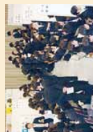
学内合同企業・公務員等説明会

実際に就職活動を始めようとする学生に役に立つ主なプログラムです。 ◆就職ガイダンス「これから始める就職活動」 ◆就活支援バスツアー ◆就職ガイダンス「業界・企業・職種研究法」 ◆公務員面接対策 ◆ビジネスマナー講習会 ◆教員採用対策セミナー ◆エントリーシートの書き方・面接対策講座 ◆筆記試験・SPI対策講座 ◆自己理解セミナー ◆職務適性テスト ◆学内合同企業・公務員等説明会 ◆外国人留学生のための就職セミナー