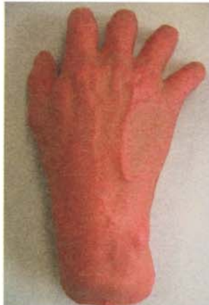
図2. 人間そっくりの外観と触感を同時に有する表面素材