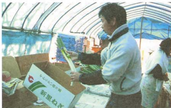
新里ネギは曲がっているため箱詰めが難しい

新里ネギは、新里町の新里ネギ生産者組合で生産・販売されています。組合員は現在13名、ネギの専業農家がほとんどです。栽培面積はそれぞれの農家が1～2ha程度、収量は10アール当たり2トン程度です。収穫後は専門の卸売業者へ出荷するほか、個人の固定客がお歳暮用として購入することが多いそうです。