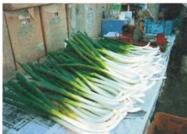
皮がむかれて綺麗な新里ネギ、白い部分が船底のように曲がっている

むかれていきます。昔はネギについた泥を水で洗っていました。その作業は、主にネギ農家のお嫁さんの仕事で