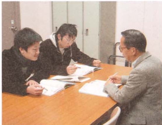
学生へのアドバイス