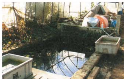
今は使われていない昔のネギの洗い場

このように新里ネギは、播種から収穫までを含めて10ヶ月近くかかります。畑を占有している期間が長く、収益の機会には年に一回だけとなります。また、梅雨や台風といった天災に遭うリスクが高く、収益性の確保が難しい野菜と言えます。さらに、ネギの栽培は機械化された部分があるとしても、雑草の管理など意外と