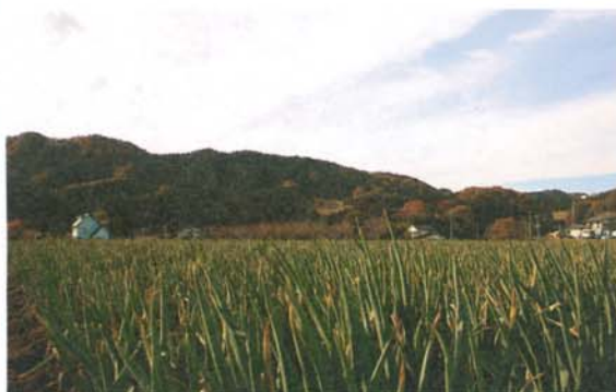
山に囲まれた穏やかな丘陵地に広がる新里のネギ畑

ネギの原産は、2200年前、中国西部の山の中だと言われています。日本では平安時代中期からネギの記録が残され、明治時代以降は政府によって積極的に栽培が奨励されてきました。日本では大まかに好みの違いがあり、関東では成長とともに土を盛り上げ、陽に当てないようにして作った甘味の強い白ネギ（根深ネギ）が好まれ、関西では陽に当てて作った辛味の強い青ネギ（葉ネギ）が好まれる傾向があります。ネギの主な栄養価は、葉の部分に多く含まれるビタミンA（カロチン）、ビタミンC、カルシウム等ですが、特有の辛みと刺激成分は疲労回復、冷え性、血液の浄化に効果的と言われています。