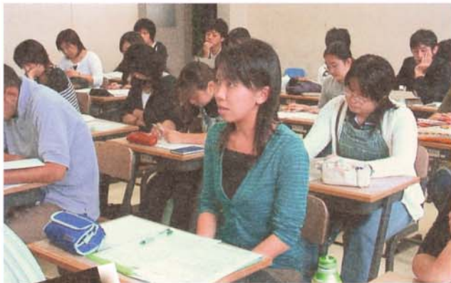
サタデースクールについて報告をする学生