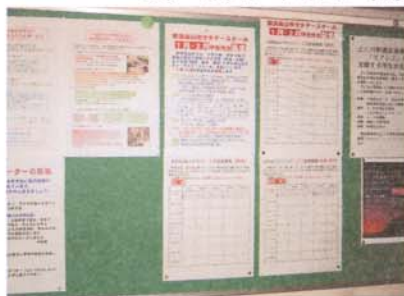
スクールサポートセンター掲示