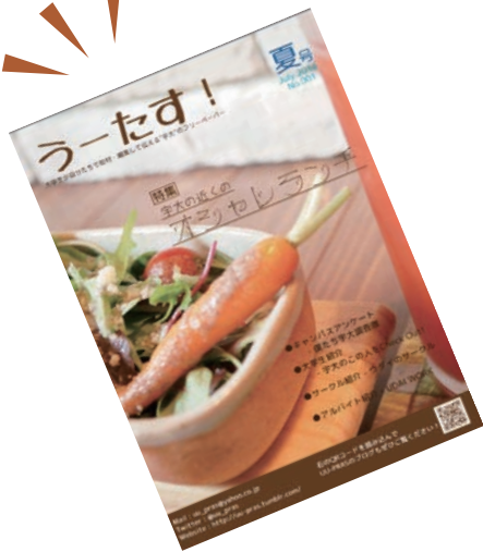
記念すべきうーたす！vol.1の表紙

Q メンバーとの日記！ 大学で楽しい・面白いと感じた人やことを形にして届けているイメージですね。