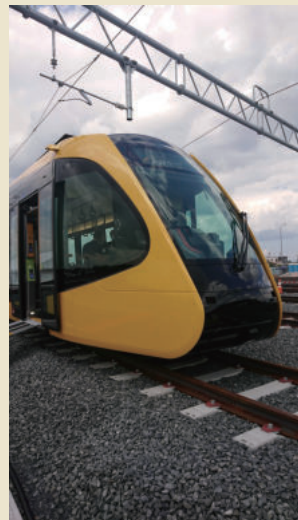
↑芳賀・宇都宮LRTの新型車両

研究を通してまちが変わっていくのを手助けできるのが楽しいです。自治体や企業と共同で研究することが多いので、研究結果を地域に還元できるのが宇都宮大学の強みでもあります。