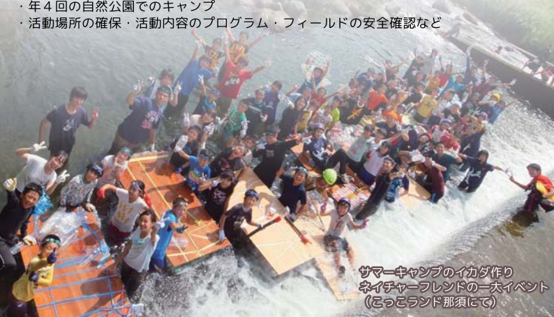
サマーキャンプのイカダ作り ネイチャーフレンドの一大イベント (こっこランド那須にて)